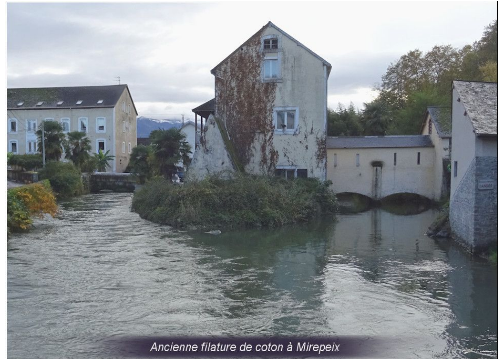
Ancienne filature de coton à Mirepeix

Tà guardar la memòria d'aquesta activitat, l'usina Blancq arcuelha uei lo Musèu deu Bonet e la Maison Carrada lo de l'industria..